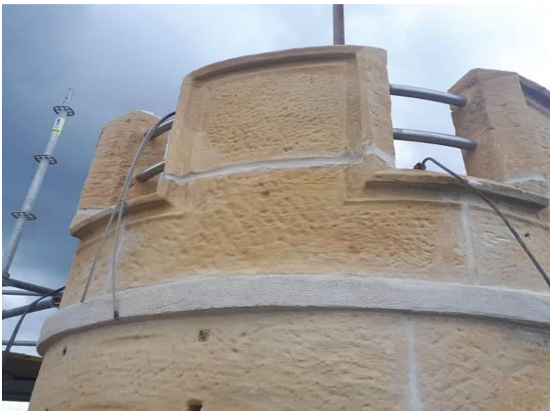
Fachada una vez restaurada