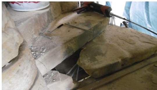
Gradas de escalera en proceso de restauración