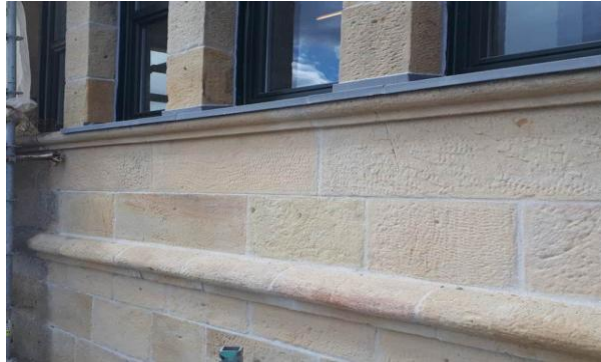
Fachada restaurada con un buen sellado de juntas