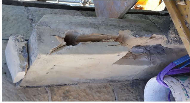
Estado de deterioro de las ALMENAS