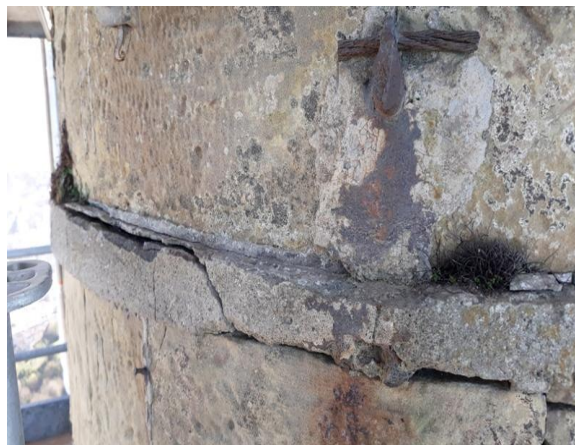
Estado del mortero de las juntas de la piedra