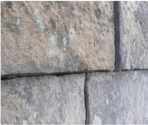
Juntas de las piedras de la fachada sin un sellado adecuado.