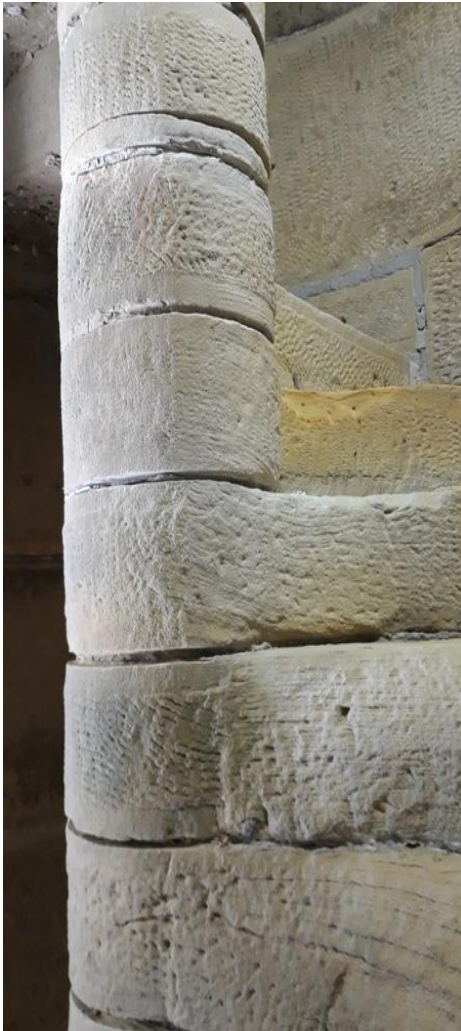
Escalera caracol antes de restaurar.