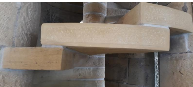
Gradas de escalera restauradas.