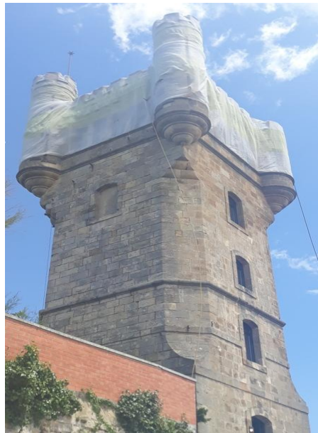
Estado del Torreón, protegido con malla por el mal estado de algunos elementos de piedra, etc.