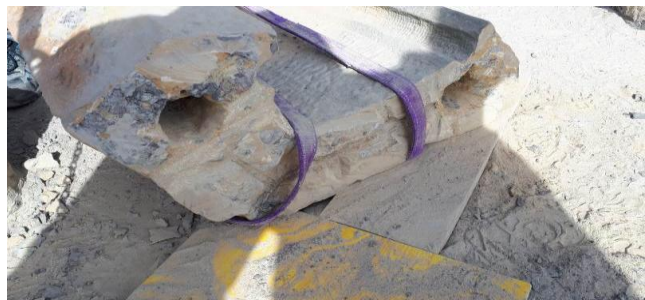
Estado de deterioro de las ALMENAS