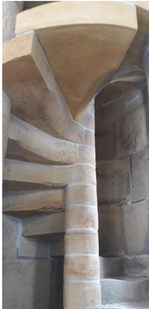
Escalera caracol restaurada