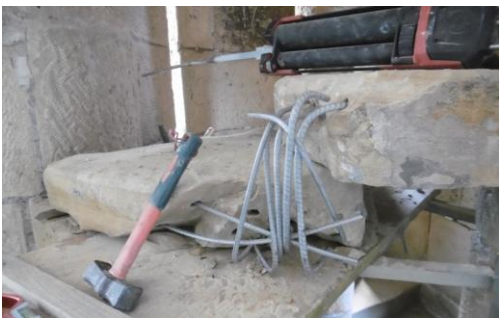
Gradas de escalera en proceso de restauración