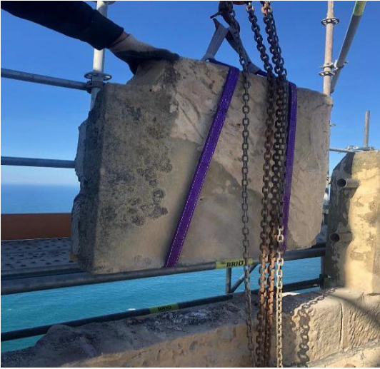
Desmontado de las ALMENAS para su restauración