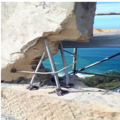
Proceso restauración de las ALMENAS incorporando armadura inoxidable.