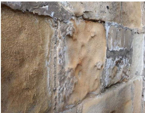
Estado de la piedra de la fachada.