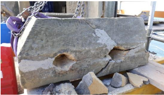
Estado de deterioro de las ALMENAS